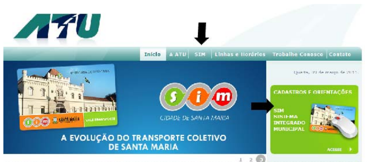
Figura-1 | Acesso ao formulário de cadastro - estudantes

Através do site ( www.atu.com.br ), acessar o ícone na página inicial ou o item de menu SIM, conforme indica figura abaixo: